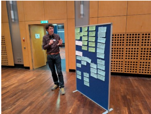
Abbildung 6: Ergebniszusammenfassung nach drei Brainstorming-Runden.

Nach einer guten Stunden Brainstorming kamen die vier Gruppen wieder in großer Runde zusammen. Die städtischen Mitarbeiterinnen und Mitarbeiter fassten die Ergebnisse der jeweiligen Gruppen überblicksartig zusammen. Dabei wurde unter anderem deutlich, dass bestimmte Themen – unabhängig davon ob Handlungsbedarfe, Bewahrenswertes oder Potentiale – parallel in mehreren Gruppen diskutiert wurden und scheinbar einen Großteil der Anwesenden beschäftigt haben. Mit Blick auf die orangen Moderationskarten (Kritik) wurde gleichzeitig klar, dass viele Anwesende für sich bereits konkrete Probleme mit detaillierten Lösungsansätzen in Verbindung gebracht haben. Im