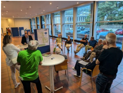
Abbildung 3: Die Leitfragen im Brainstorming lauteten u.a.: Wo sind Sie in Weinheim gerne mobil? Welche Potentiale sehen Sie?

viele Hinweise darauf, wo der Schuh drückt, was gut läuft oder wo Verbesserungspotentiale liegen. An einem Info-Desk beantwortete das Verkehrsplanungsbüro R+T fachplanerische Detailfragen und andere Rückfragen.