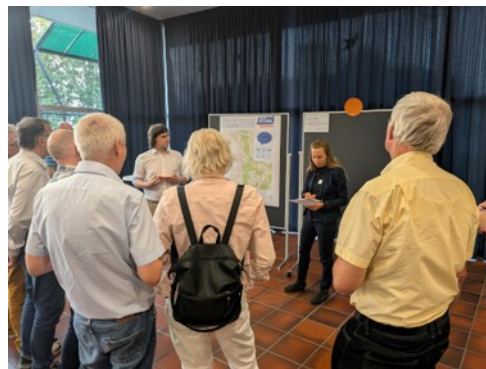
Abbildung 4: In drei Brainstorming-Runden wurden wichtige Hinweise gesammelt.